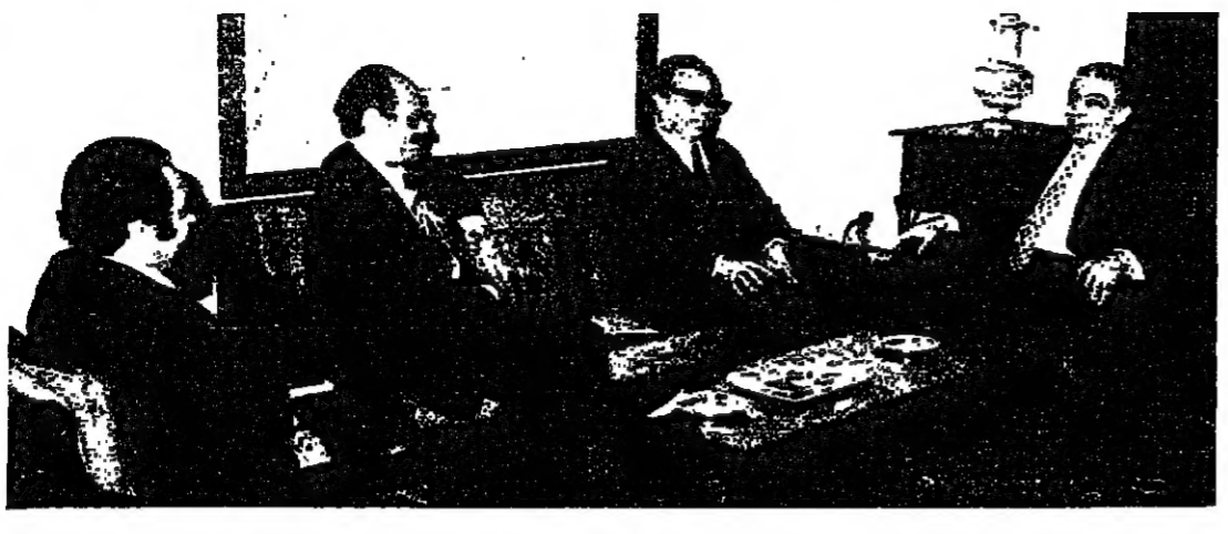
الرئيس مكيون وسفراء مصر والسعودية والكويت أثناء اجتماع اللجنة العربية الرباعية أمس